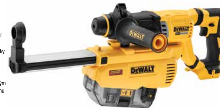
VYOBRAZEN S NÁŘADÍM DCH263 (PRODÁVÁ SE SAMOSTATNĚ)