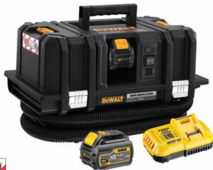
VYOBRAZENA JE SADA DCV586MT