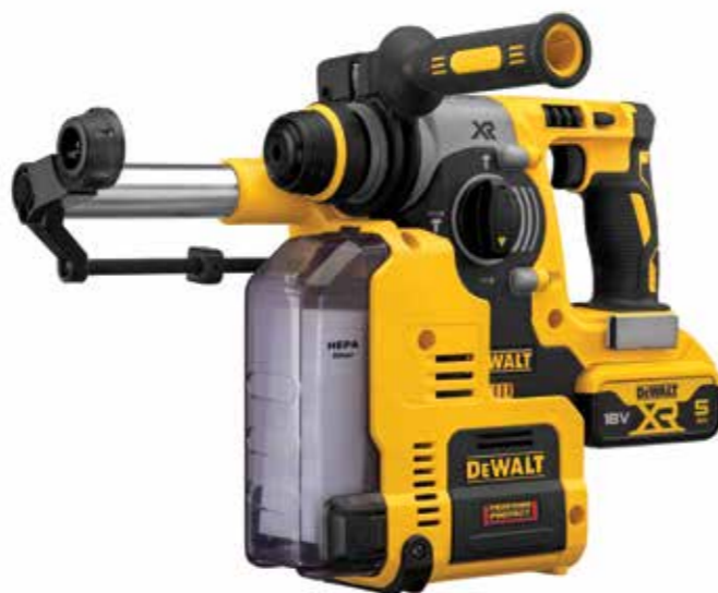
VYOBRAZEN S NÁŘADÍM DCH273 (PRODÁVÁ SE SAMOSTATNĚ)